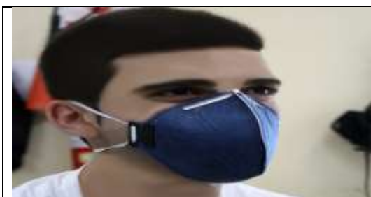
Item 2 – Lote 5