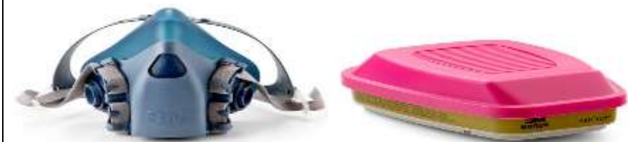
Item 1 – Lote 7